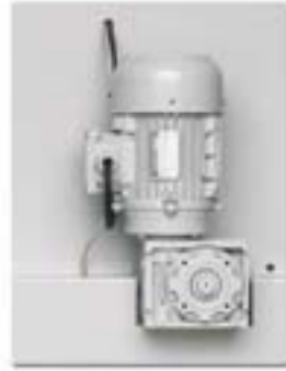
Motorlu sentil ayar sistemi Power blade gap adjustment