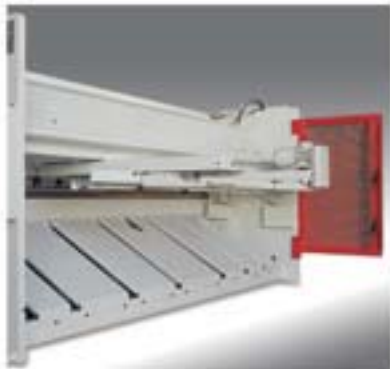
A tipi pnömatik arka destek sistemi Type A pneumatic rear support system