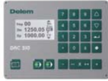
Delem DAC 310